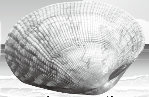
ほぼ原寸サイズ! (イメージ)