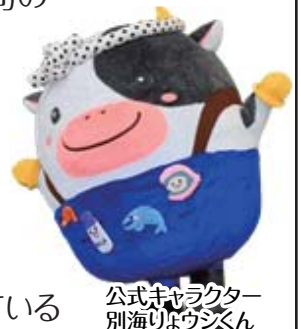
公式キャラクター 別海町のウシさん

こんにちは! オホーツク海に面した最東端の町、 別海町はおいしいものがいっぱい! ジャンボなホタテや徳川将軍にも献 上した西別鮭、北海道遺産の打瀬舟 でとるシマエビが自慢だウシ～。今回 のイベントでは、旬の エビを味わえるメ ニューや、楽しい アトラクションが 盛りだくさん。