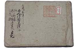
江戸時代の古文書