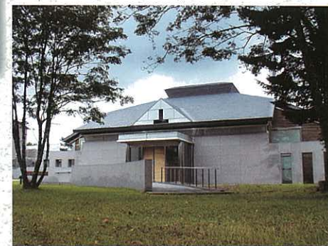
かがけもんじょかん 加賀家文書館

べつかいちょうきょうどしりょうかん かがけもんじょかん べつかいちやう れきし しぜん かがけ 別海町郷土資料館と加賀家文書館は、別海町の歴史や自然、「加賀家 文書」のことをみなさんによく知ってもらおうように、次のような仕事 をしています。