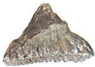
マンモスソウ臼歯化石