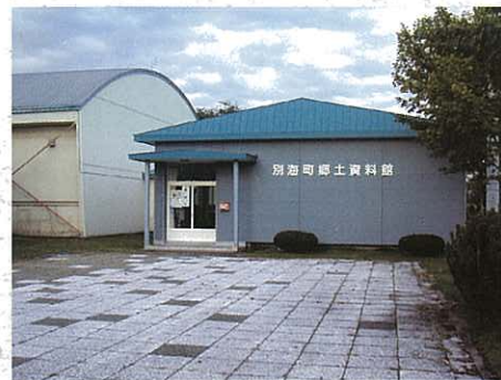
べつかいちょうきょうどしりょうかん 別海町郷土資料館

べつかいちょうきょうどしりょうかん 別海町郷土資料館 〒086-0201 北海道野付郡別海町別海宮舞町30 でんわ・FAX 0153-75-0802 かがけもんじょかん 加賀家文書館 〒086-0201 北海道野付郡別海町別海宮舞町29 でんわ 0153-75-2473